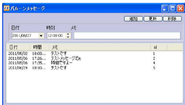
図3 バルーンメッセージ

付箋ランチャー上でマウス右クリックで「バルーンメッセージ」を選択し、図3バルーンメッセージを表示します。設定した日付と時刻にメモに設定したメッセージをタスクバーからのバルーンメッセージとして表示します。